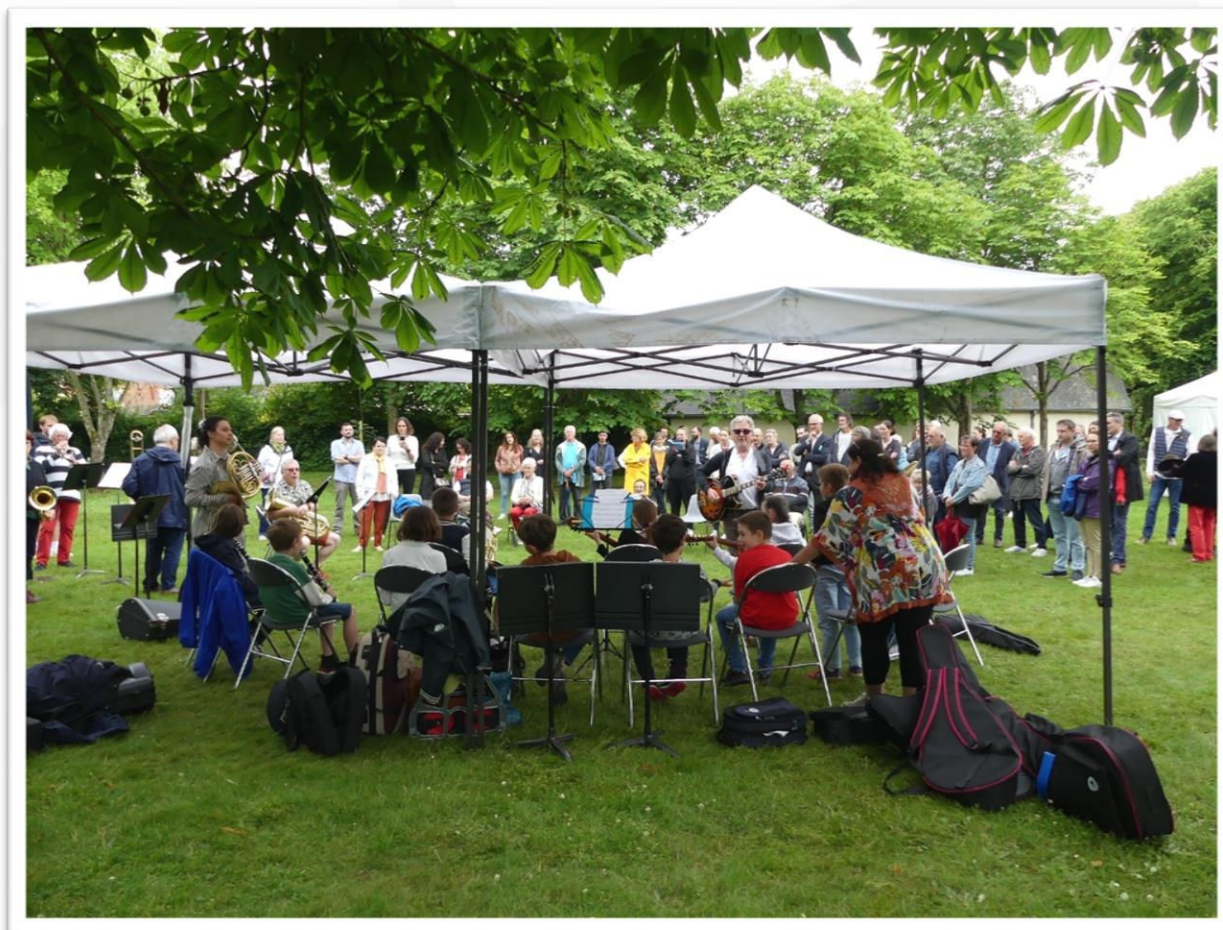
Photo de l'inauguration du Sentier d'art 2024 à Beamesnil