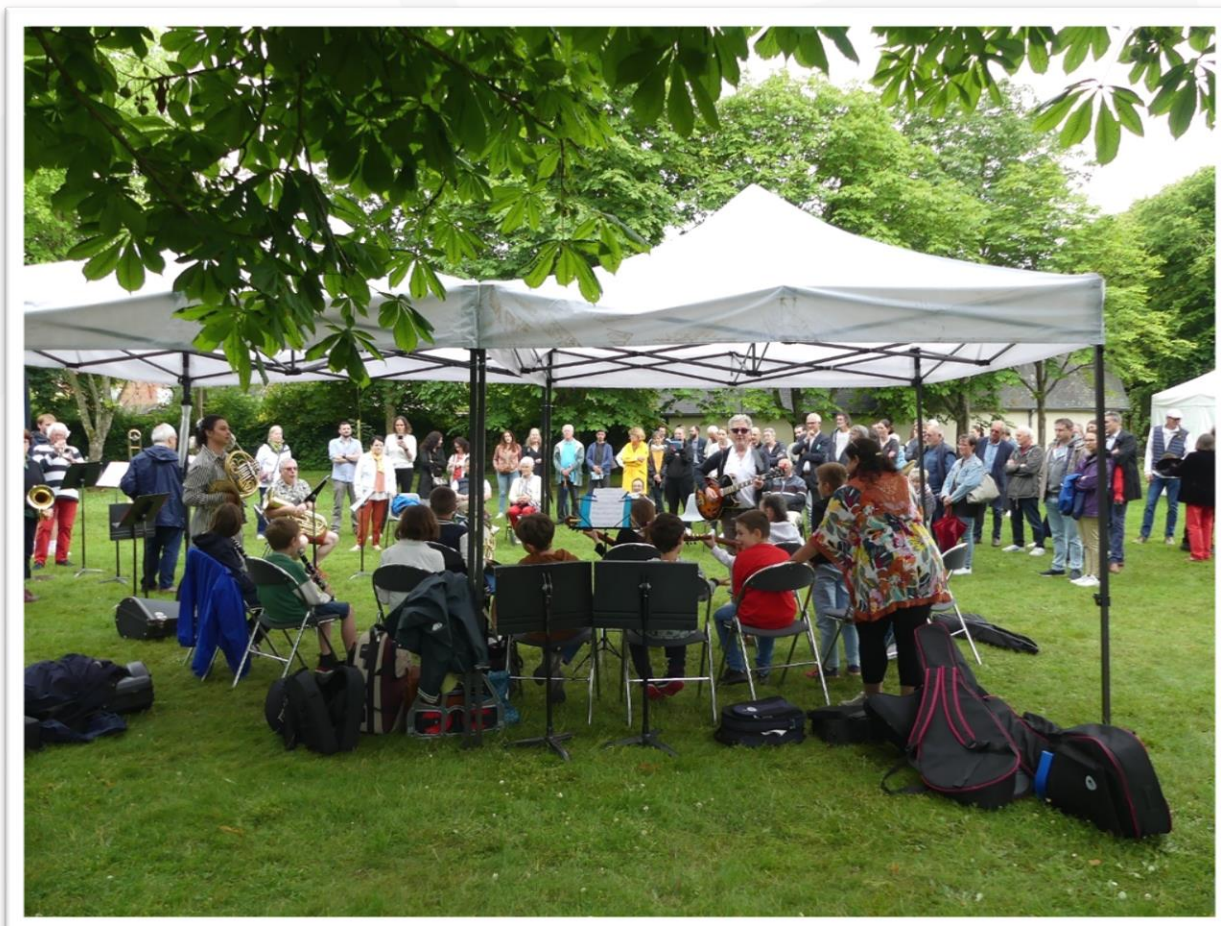
Photo de l'inauguration du Sentier d'art 2024 à Beamesnil