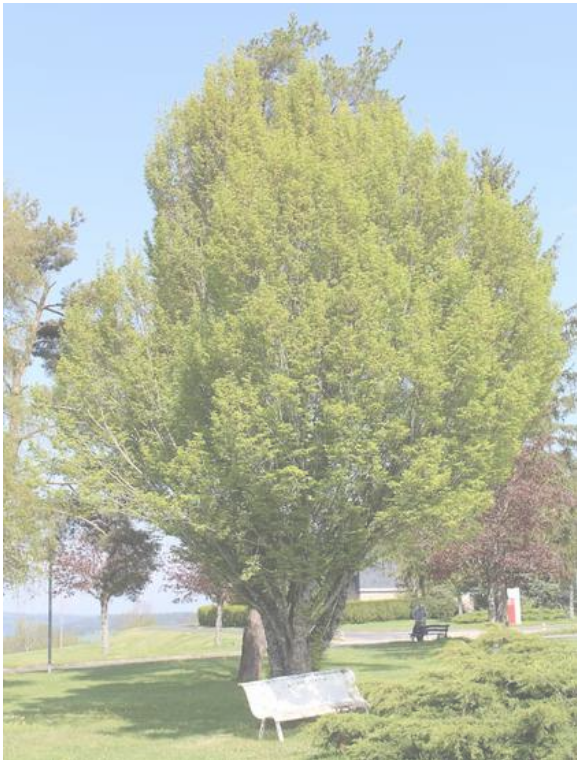
Parole de jardiniers : noisetier à long bec. Banc pour contempler les écureuils.